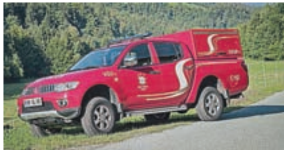
Večnamensko vozilo z izmenljivim modulom

V vseh letih ter ob različnih upravnih odborih so in se še vedno na prvo mesto postavljajo izobraževanje ter vzdrževanje in posodabljanje gasilske opreme. To je, kot poudarjajo, osnova za učinkovito operativno dejavnost. Nabor nalog, ki jih opravljajo gasilci, je namreč širok in se z leti dopolnjuje. Zato so se odločili za nadgradnjo večnamenskega »pickup« vozila z izmenljivim modulom za gašenje gozdnih in začetnih požarov. V nadgradnji so rezervoar z visokotlačno črpalko, izolirana dihalna aparata, motorna žaga ter komplet zaščitne opreme za delo