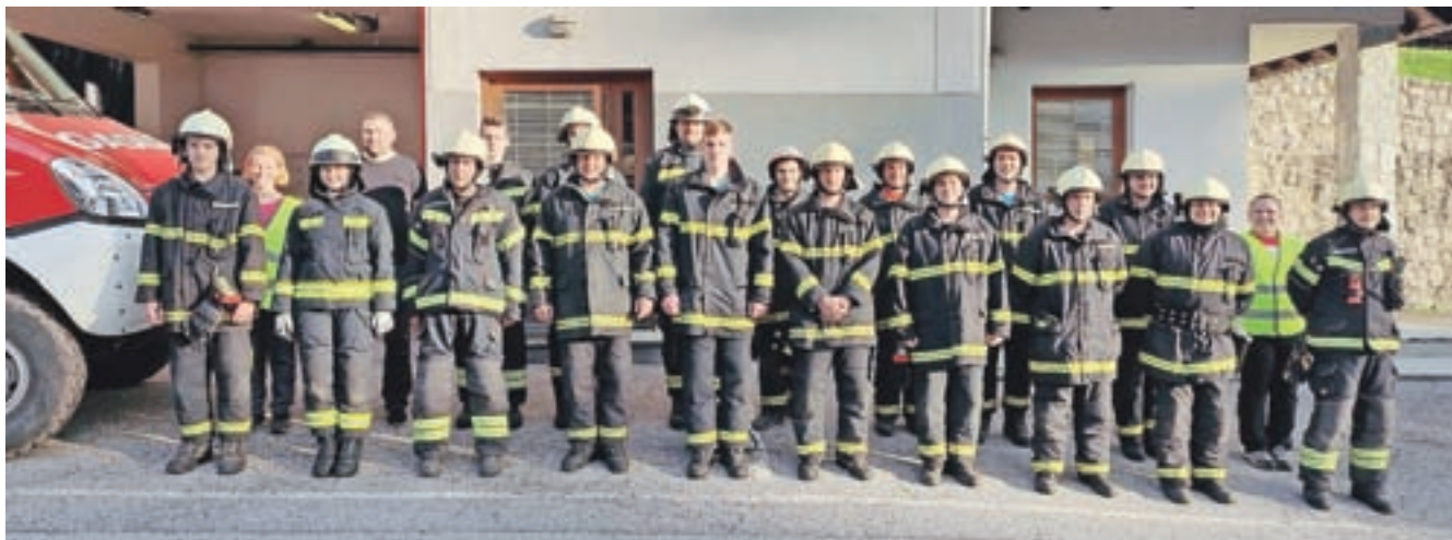
Operativni člani društva

Aktivnosti za izdelavo nadgradnje so stekle lansko jesen, na dokončanje pa je vplivala tudi spomladanska karantena. Slovesen prevzem pridobitve je bil predviden na veselici, ki so jo načrtovali ob jubileju, vendar je oboje zaradi trenutnih razmer neizvedljivo. Najpomembnejše pa je, da bo naložba dobro služila namenu, pravijo v upravnem odboru društva. Jubilej kljub vsemu še nameravajo zaznamovati, vendar v drugačni obliki.