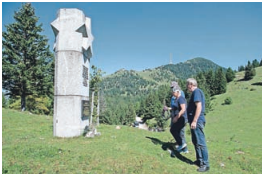
Pri osrednjem spomeniku na planini Jezerca na Krvavcu je delegacija ZB za vrednote NOB Cerklje položila venec.