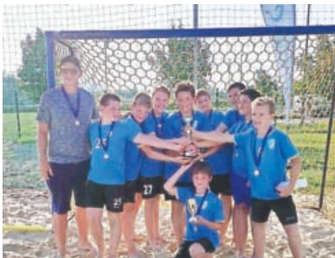
Cerkljanski rokometiši so se veselili naslova državnih podprvakov v rokometu na mivki.

RK Cerklje vse rokometne navdušence vabi, da se jim pridružijo v klubu. Rokometiši vseh selekcij trenirajo pod vodstvom izkušenih in strokovno usposobljenih trenerjev. Strokovni vodja mlajših selekcij je Pegi Berce s trenersko licenco EHF PRO. Z novim šolskim letom ponujajo razširjen program vadbe v mini rokometu, ki se je začela 21. septembra.